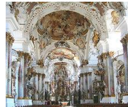
Abbaye de Zwiefalten ( Allemagne)

En sculpture et en architecture, c'est le style ROCOCO qui s'impose. C'est une profusion de motifs et de dorures. Le but est d'émerveiller le spectateur et lutter contre le protestantisme.