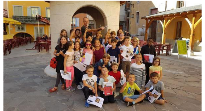
Visite de l'exposition sur la Première Guerre Mondiale