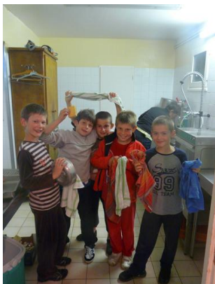
Une équipe de choc à la vaisselle !

J'ai bien aimé ce voyage scolaire, j'ai appris beaucoup de choses très intéressantes. Sur le chemin du retour nous nous sommes arrêtés à la grotte de Choranche. C'est l'eau qui a creusé les grottes. Nous avons vu des protées, ce sont des animaux qui vivaient il y a très très longtemps. J'ai bien aimé cette visite. Les protées viennent d'une grotte en ... Les protées sont les ancêtres des salamandres. La grotte de Choranche est connue pour ses fistuleuses.